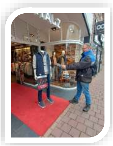
Een ludiek moment

De dames gaan in het gebouw bezig met het maken van kerstkaarten. Aan het eind van de ochtend hebben ze zo'n twintig kaarten klaar. We kunnen ze straks met Kerst uitdelen op straat. Terwijl er in het gebouw geknutseld wordt, gaan wij met ons vieren de straat op. We delen foldertjes uit en proberen waar mogelijk gesprekken aan te gaan. Het is vandaag koud, waardoor weinig mensen echt belangstelling tonen. Maar we vertrouwen erop dat Gods Woord niet nutteloos zal zijn. Het zal doen wat Hem behaagt. Hij gaat ermee verder.